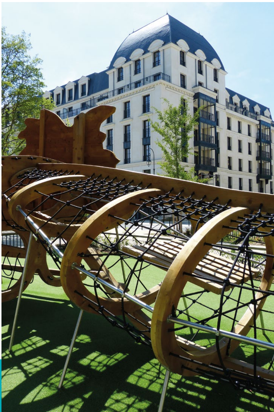
Quartier Panorama, 4 rue Louise Bourgeois

En 2025, Vallée Sud Habitat poursuivra la mise en œuvre de son programme visant à améliorer la performance énergétique des logements, moderniser les résidences, élargir l'offre de logements, renforcer la qualité de service aux locataires et promouvoir un aménagement urbain durable.