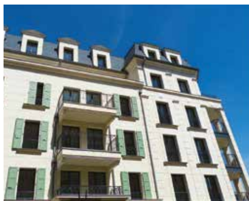
5 et 6 allée Marina Tsvetaieva.