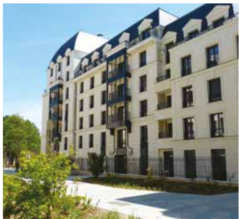
4 allée Louise Bourgeois.

Dans ce nouveau quartier, à 5 km de Paris, 171 logements ont été livrés. Les habitants profiteront d'une place centrale jouxtant le lac, de diverses ambiances paysagères et de nombreux équipements : une crèche, un groupe scolaire de 21 classes, un gymnase, des commerces de proximité desservis par un parking public en sous-sol de 200 places et 2,2 hectares de plan d'eau.