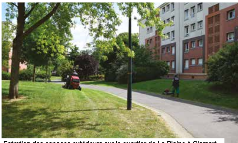
Entretien des espaces extérieurs sur le quartier de La Plaine à Clamart.

145 collaborateurs engagés dans une logique de proximité au service des résidents.