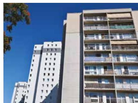
21 avenue de la république à Châtillon.

Rue René Samuel, Vallée Sud Habitat a acquis 7 logements pour les rénover. 13 mois de travaux sont prévus, qui ont commencé en mai 2021 par les phases de déplombage et désamiantage. Confort, sécurité et économies d'énergies seront particulièrement améliorées, à travers d'importants travaux à l'intérieur, mais aussi une révision complète de la toiture, la mise en place d'une isolation thermique, l'isolation des combles, le remplacement de toutes les fenêtres, ainsi que le contrôle et le remplacement de la zinguerie.