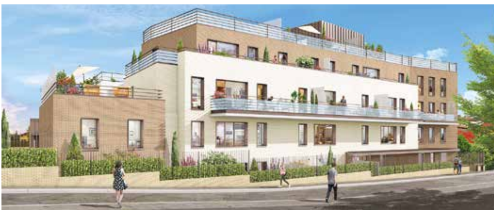
Vallée Sud Habitat a acquis 15 logements sur les 58 que compte le programme de la Villa Flore à Châtillon, ainsi que 7 emplacements de parking.

À Châtillon, la villa Flore, 15 logements, proposera un cadre de vie citadin et verdoyant, avec ses nombreux parcs et jardins ainsi que la coulée verte du Sud Parisien qui permettent de se rapprocher de la nature sans renoncer à la vie pratique. En centre-ville, l'ambiance de petit village est restée intacte. Son art de vivre est animé, entre autres, par les commerces de proximité et son marché.