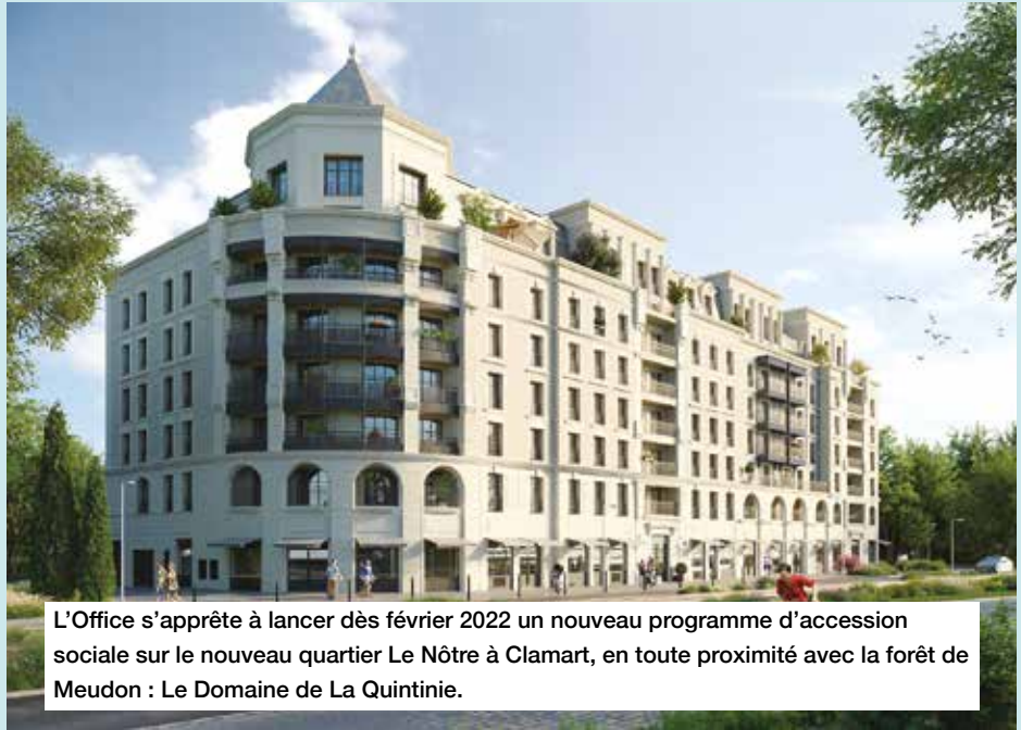
L'Office s'apprête à lancer dès février 2022 un nouveau programme d'accession sociale sur le nouveau quartier Le Nôtre à Clamart, en toute proximité avec la forêt de Meudon : Le Domaine de La Quintinie.

Pour accentuer la mixité sociale et proposer aux résidents de s'inscrire dans un parcours résidentiel complet, Vallée Sud Habitat propose deux types d'accession à la propriété :