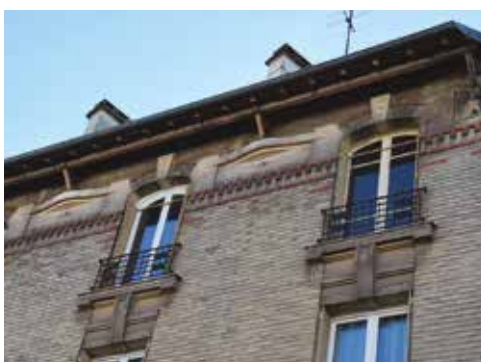
3 avenue René Samuel à Clamart.