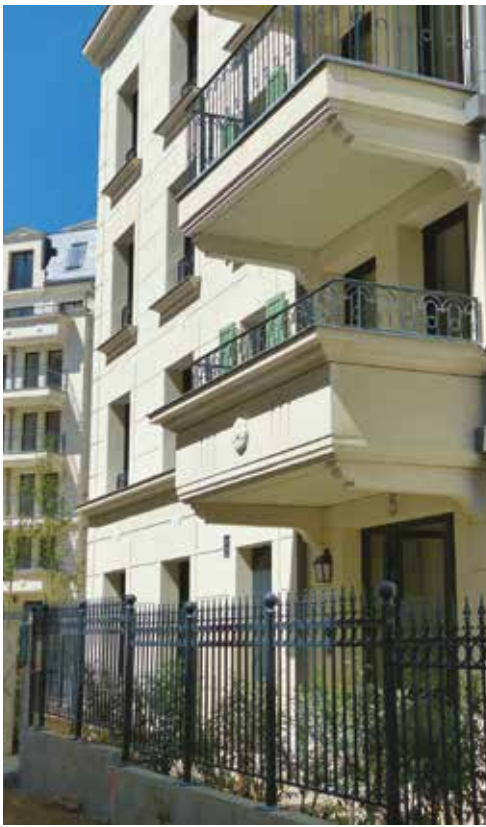
Dans le nouveau quartier du Panorama à Clamart, Vallée Sud Habitat propose des logements en location.