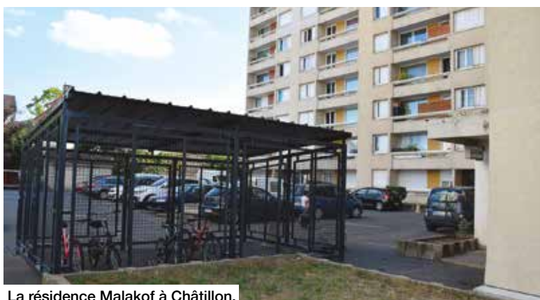
La résidence Malakof à Châtillon.

Également créé en 1949, le patrimoine de Châtillon Habitat se composait de 1365 logements regroupés en 15 ensembles immobiliers, 14 locaux commerciaux et 1097 places de stationnements.