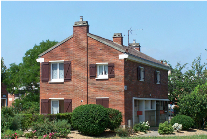
Pavillon double, allée de Corse.