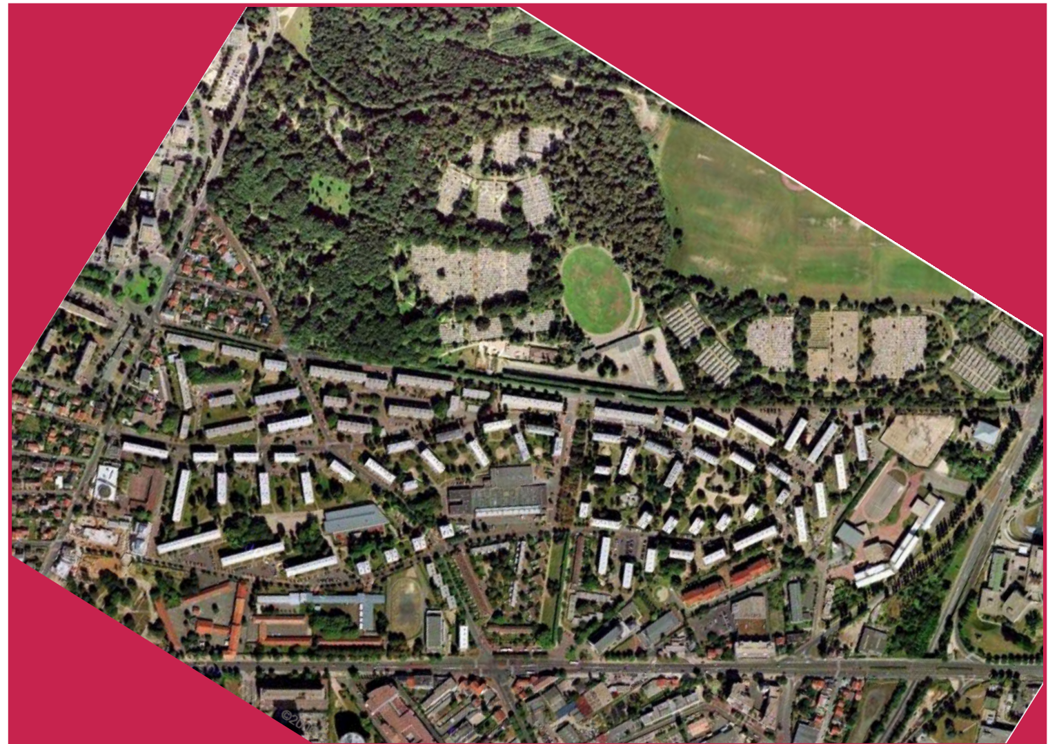
La cité de la Plaine et le cimetière intercommunal aujourd'hui.

Les constructions qui suivent immédiatement ces premières réalisations, bien que concernant des immeubles collectifs, confirment ce goût pour l'espace communautaire de voisinage et un certain rejet de la rue vers laquelle s'orientent plus volontiers les espaces de services tels que les locaux de stockage des ordures ménagères plutôt que les halls d'entrées des immeubles. Avec les bâtiments A1 à A9 et C, apparaissent les premiers logements collectifs et l'amorce d'une véritable cité s'organisant autour d'un espace central, bientôt occupé par les