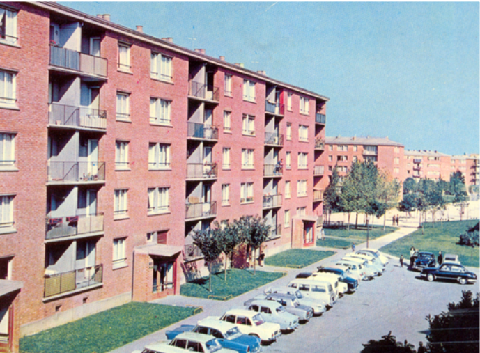
Carte postale de la cité de la Plaine, années 60.

L'étude d'urbanisme montre bientôt qu'il serait opportun d'ajouter aux terrains résiduels situés le long de la voie d'accès au cimetière, tous les terrains situés entre la route nationale et le chemin de la Porte de Trivaux : ainsi, se réaliserait un quartier complet qui rejoindrait les lotissements pavillonnaires du Haut-Clamart.