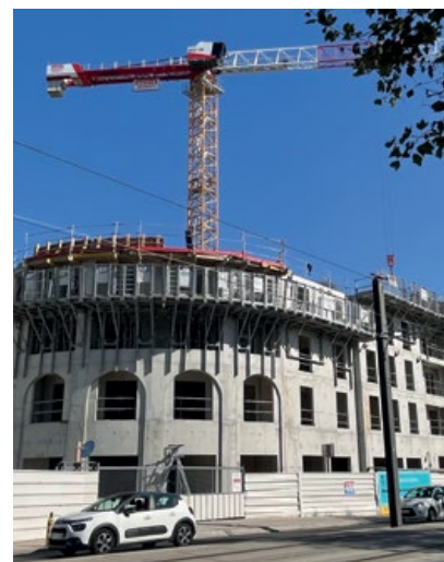
Le Domaine de la Quintinie en construction (sept. 2023) et tel qu'imaginé par les architectes.

la profonde transformation du quartier. Fini les bâtiments obsolètes en termes de confort, composés de tours et de barres datant de 1964. Place à l'aménagement d'un quartier apaisé, à l'architecture classique. Les matériaux mis en œuvre sont d'ailleurs liés à cette conception noble et comprennent le zinc et l'ardoise pour les toitures, la pierre pour les façades et le métal pour les garde-corps.